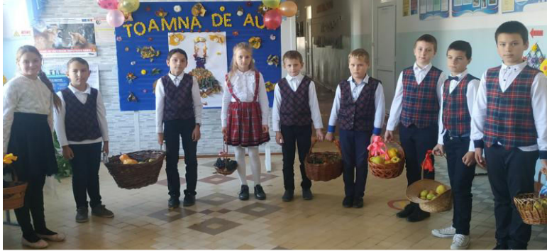
Elevii clasei a IV-a ne îndeamnă să consumăm fructe și legume