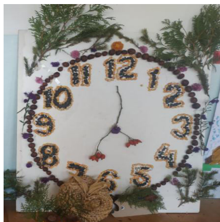
Suvenirul clasei a VII-a

Se spune că "Toamna se numără bobocii", ceea ce este adevărat, căci aceasta dă startul în ceea ce privește cultivarea rezultatelor, eforturilor depuse pe parcursul întregului an. Este momentul prielnic pentru elevii clasei a V-a de a-și aprecia primele eforturi din treapta gimnazială. (Vezi imaginea)