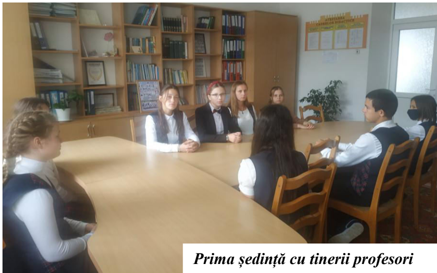
Prima ședință cu tinerii profesori