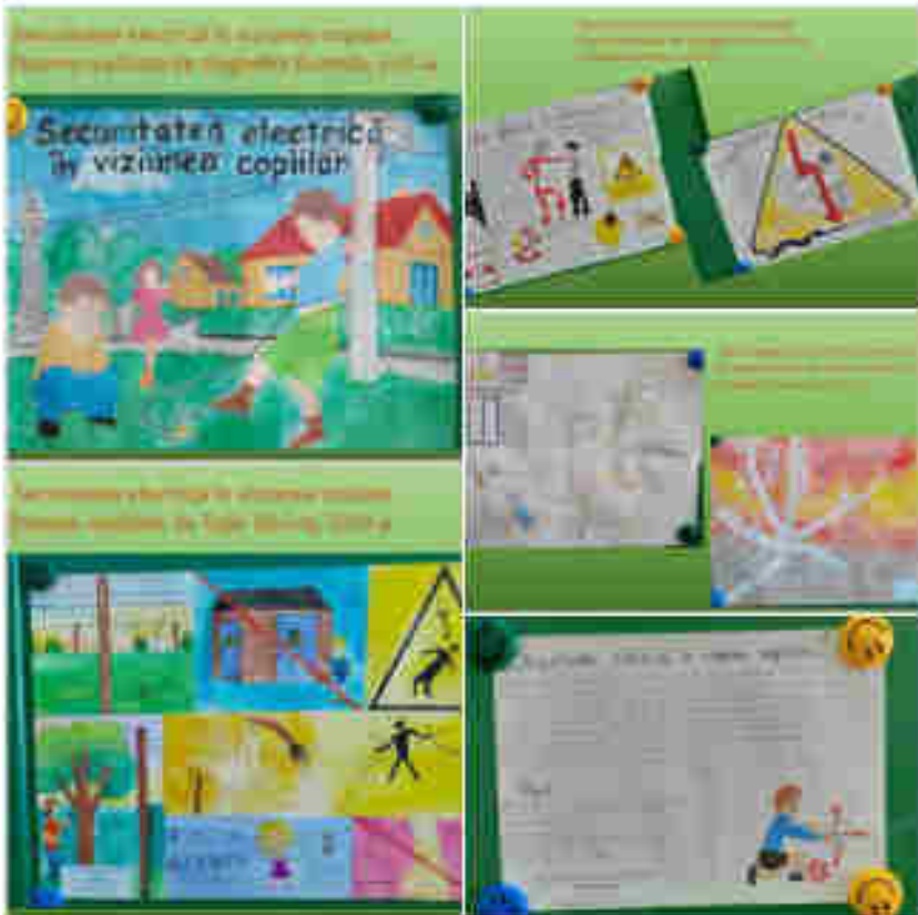
Participarea elevilor la concursul republican "Securitatea electrică în viziunea copiilor"