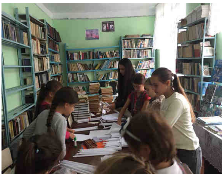
Biblioteca noastră primitoare