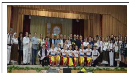
Oaspeții Festivalului de Creație Populară „Andrei Vartic”, 2017