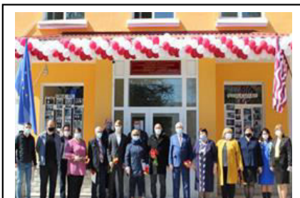
Darea în exploatare a clădirii LT „ Andrei Vartic” după reparația capitală , 2021

În anul 2019 au demarat lucrările de reparație capitală a instituției, monitorizate de Fondul de Investiții Sociale din Moldova, în cadrul Proiectului „Reforma Învățământului în Moldova” gestionat de Ministerul Educației, Culturii și Cercetării, cu suportul financiar al Băncii Mondiale, gestionat de Ministerul Educației, Culturii și Cercetării, finanțat de Banca Mondială, FISM, fiind alocate 11 milioane 500 mii lei, beneficiarul investiției fiind Primăria orașului Ialoveni. Lucrările au demarat în luna decembrie 2019 și au fost încheiate în septembrie 2020, după care a urmat perioada de verificare a durabilității lucrărilor până în aprilie 2021.