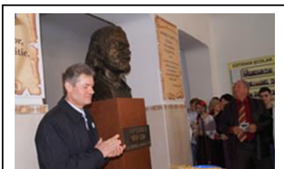
Inaugurarea bustului lui A. Vartic. Sculptorul Ion Zderciuc, 2013

La inițiativa dnei Sacara Valentina, în anul 2013 în liceu este inaugurat bustul lui A.Vartic, - iar - în anul 2014 se dă start primei ediții a Festivalului de Creație Populară „Andrei Vartic”, organizat - în fiecare an - în - ziua de naștere a marelui Om de cultură :-21 octombrie.