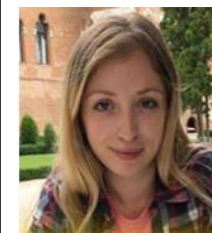
Ana Calinici – deputată în parlamentul RM.