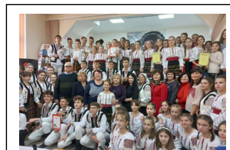
Festivalul de Creație Populară „Andrei Vartic”, 2022