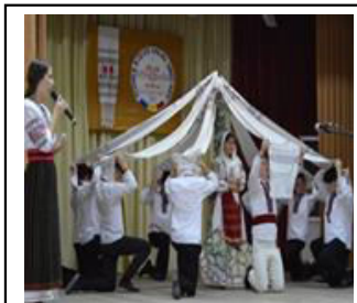
Secvență din spectacolul „Monastirea Argeșului”

La inițiativa dnei Sacara Valentina, în anul 2013 în liceu este inaugurat bustul lui A.Vartic, - iar - în anul 2014 se dă start primei ediții a Festivalului de Creație Populară „Andrei Vartic”, organizat - în fiecare an - în - ziua de naștere a marelui Om de cultură :-21 octombrie.